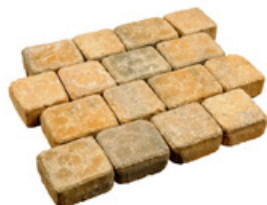
Nuancé vieil argent