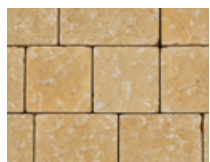
Sable saumon nuancé