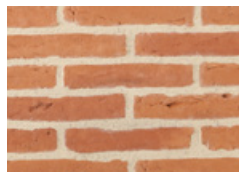
Rose Toulouse (coloris uni)