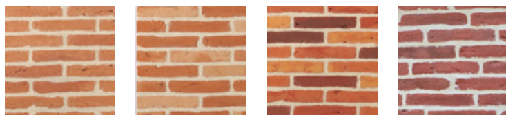
Rose Toulouse (coloris uni)